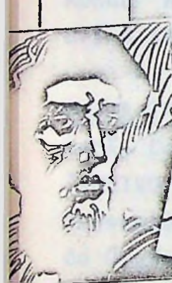
Pedro Álvares Cabral