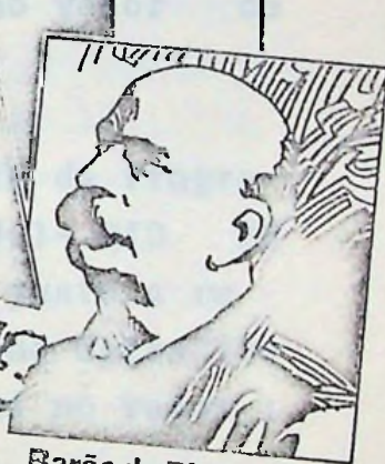
Barão do Rio Branco

Na Independência do Brasil, Tiradentes surge como o protomártir das lutas do nosso povo pela emancipação política, pela construção de uma nação livre, democrática e soberana.