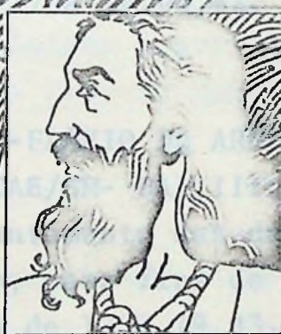
Joaquim José da Silva Xavier (o Tiradentes)