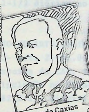
Duque de Caxias