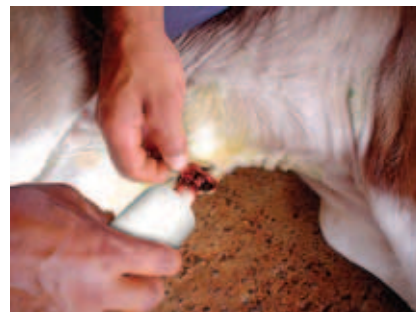
ASSEPSIA DO UMBIGO

É recomendado pesar os bezerros no dia seguinte ao nascimento. O ideal é usar balanças portáteis para que possam ser levadas ao pasto-maternidade. Caso não haja disponibilidade de balança na fazenda pode-se avaliar o peso dos bezerros considerando três categorias: leve, médio e pesado.